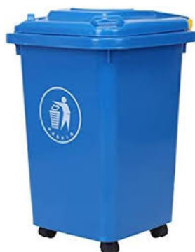
Bacs en PVC