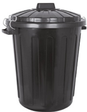
Bac en PVC